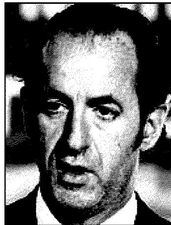
Il governatore Luca Zaia