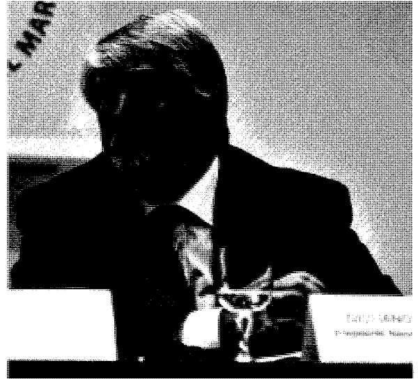
Giuliano Poletti, presidente Nazionale di Legacoop

S viluppo, innovazione, giovani. E' su queste direttrici che Legacoop Sicilia aprirà domani 16 dicembre, alla facoltà di Economia e Commercio di Palermo (aula Vincenzo Li Donni), un confronto con governo regionale e nazionale per mettere a punto una strategia comune per la ripresa economica del Mezzogiorno e la nascita di nuove cooperative giovanili. Attorno al tavolo il Ministro dello Sviluppo Economico Flavio Zanonato , il governatore Rosario Crocetta e gli assessori regionali all'Economia, Luca Bianchi e alla Formazione, Nelli Scilabra . Per Legacoop, da Roma arriverà anche