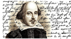
10 cose che non sapete su William Shakes ...