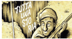
Bandierine. La Resistenza a fumetti