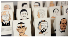
24 segnalibri magnetici per lettori di f ...