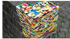
Restaurare con i Lego: il genio di Jan V ...