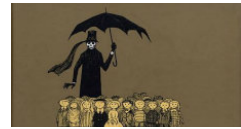
Impara a leggere con i bambini morti: il ...