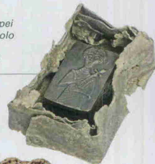
Qui sotto: reliquiario a capsella, da Trento, chiesa di S. Apollinare. VII sec.