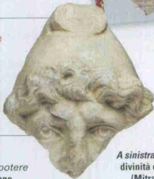
A sinistra: testa di divinità orientale (Mitra o Attis). II-III sec. d.C.