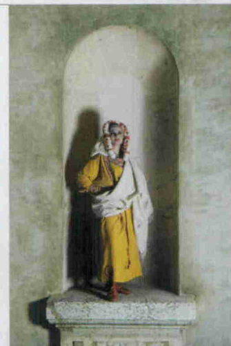
A destra: ricostruzione di uno degli abiti trovati ad Antinopoli.

Visioni di eleganza nelle solitudini Musée des Tissus Musée des Arts Décoratifs fino al 28.02.14