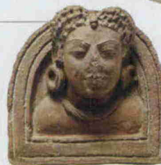
A sinistra: formella con busto femminile. Dinastia Gupta.

Dal tempio alla corte, capolavori dell'arte indiana Casa dei Carraresi fino al 31.05.14