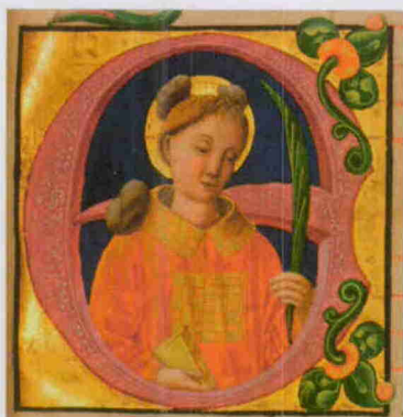
Capolettera istoriato con Santo Stefano di "Graduale de tempore feriale festivo", fine XV secolo, Lombardia.