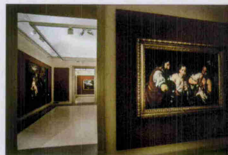
Scorcio delle sale della pinacoteca palermitana di Villa Zito, con dipinti del XVII secolo.

Lo scorso giugno ha riaperto Villa Zito, storica dimora palermitana, nelle nuove vesti di pinacoteca estesa su circa mille metri quadrati espositivi, disposti su tre piani. Lungo le sue sale sfilano quattro secoli di pittura (dal Seicento al Novecento) provenienti dalla collezione della Fondazione Sicilia. Il percorso si apre con le opere seicentesche di Mattia Preti, Bernardo Strozzi, Luca Giordano, Salvator Rosa e paesaggi che annunciano il vedutismo del XVIII secolo, per proseguire con l'Ottocento di Francesco Zerilli, Francesco Lojacono, Vincenzo Caprile e il Novecento di Sironi, Carrà, Schifano e Guttuso, tra gli altri.